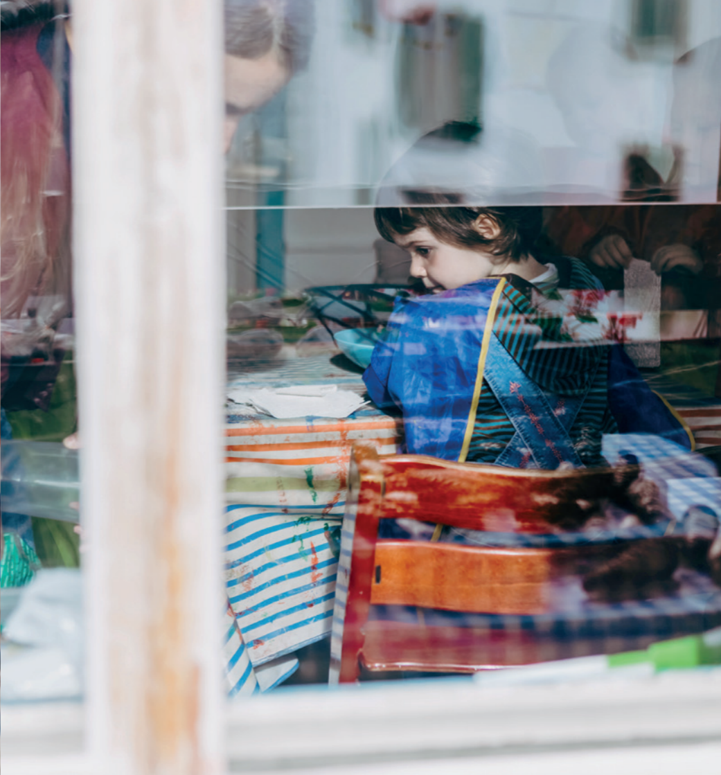
Konzentriert bei der Arbeit