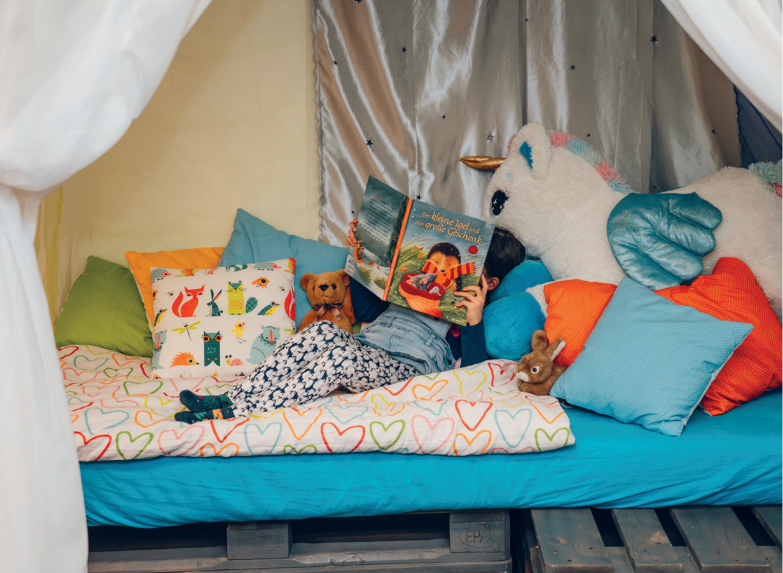
In der gemütlichen Höhle entspannen und ein Buch lesen.