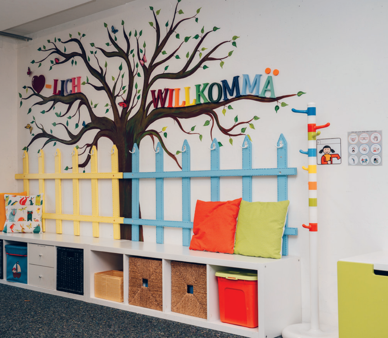
Herzlich willkommen in der SEB Dallenwil